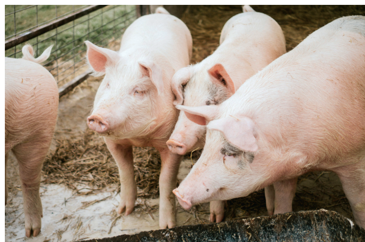
Décidément, tout est bon dans le cochon.

On n'arrête pas le progrès. Le groupe Olot Meats, installé dans la Garrotxa, franchit une nouvelle étape en annonçant la valorisation d'une partie de ses résidus de graisse porcine pour produire du biocombustible. Cette initiative découle d'une alliance stratégique avec Bioscor, entreprise spécialisée dans la transformation de déchets organiques en matière première destinée à la fabrication d'énergies renouvelables. Olot meat, qui rassemble trois entreprises, est un des acteurs majeurs de la filière porcine. L'objectif du partenariat consiste à convertir les sous-produits gras non utilisables dans la chaîne alimentaire en un composant du SAF (Sustainable Aviation Fuel), un carburant destiné à remplacer progressivement le kérosène dans l'aviation. Cette démarche répond à une logique d'économie circulaire, qui permet au groupe de réduire son empreinte carbone tout en créant de nouvelles ressources énergétiques à partir de déchets jusqu'alors sans débouchés. Outre la production de biocombustibles, la collaboration avec Bioscor ouvre également la voie à d'autres usages des sous-produits, notamment pour l'alimentation animale ou diverses applications industrielles.