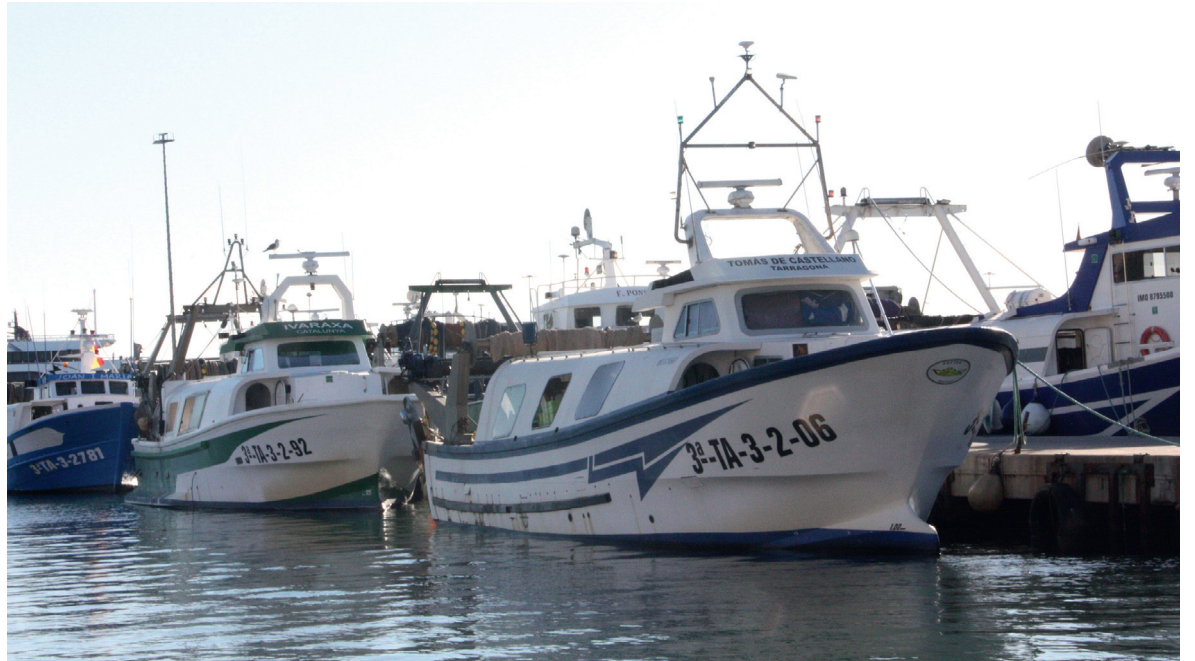
Sur la Costa Daurada, au sud de Barcelone, la moitié des pêcheurs avaient déjà atteint leur nombre maximal de jours de sortie autorisés dès le début du mois de novembre.