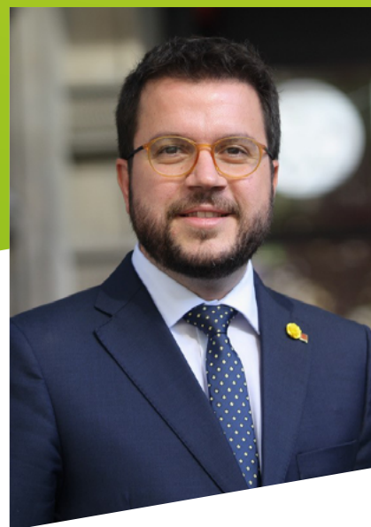
Presidente de la Generalitat de Cataluña