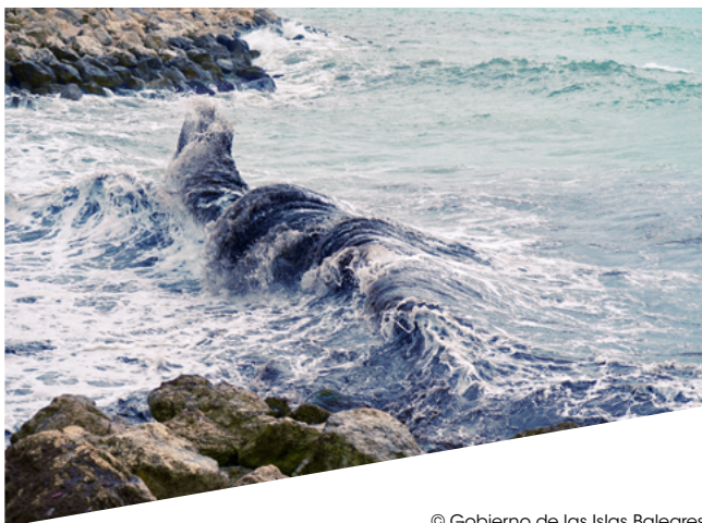
© Gobierno de las Islas Baleares

Estructurada en Agrupación Europea de Cooperación Territorial desde 2009, la Eurorregión Pirineos Mediterráneo ha demostrado su capacidad para movilizar a los actores de su territorio en sectores clave, tales como la economía, la innovación, la investigación, la educación superior, la cultura, el turismo y el medio ambiente. Debido a su historia, sus valores comunes y sus ambiciones cruzadas, la Generalidad de Cataluña, el Gobierno de las Islas Baleares y la Región de Occitania desean proseguir a través de la Eurorregión la construcción de un polo de cooperación de referencia en este cruce de caminos de Europa y en pleno corazón del Mediterráneo.