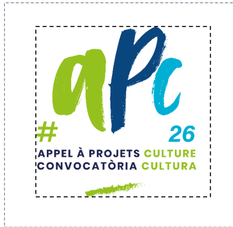
Espai de protecció al voltant dels logos