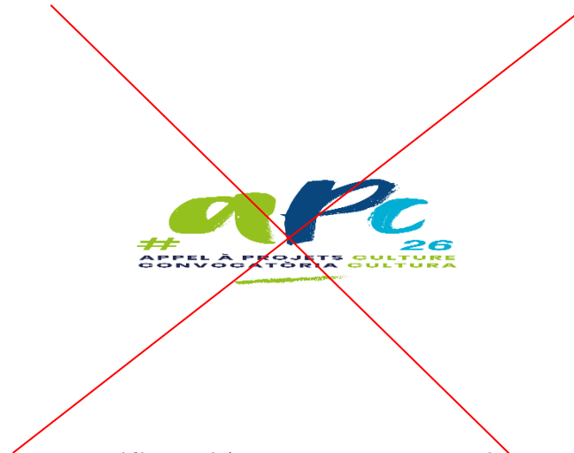
Modificació de les proporcions