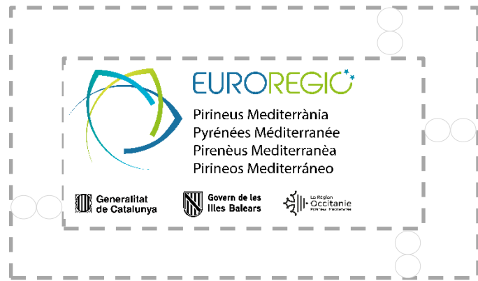
Espai de protecció al voltant dels logos