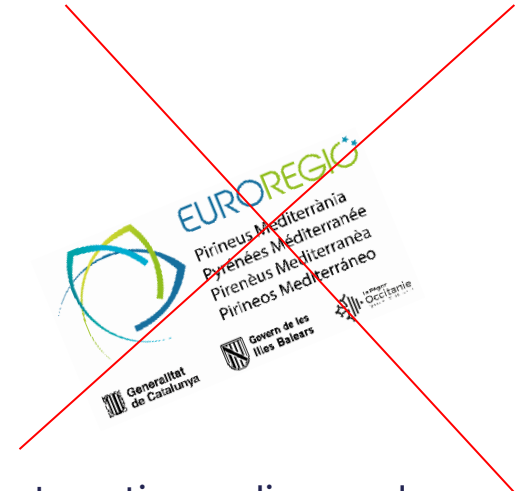
Logotip en diagonal