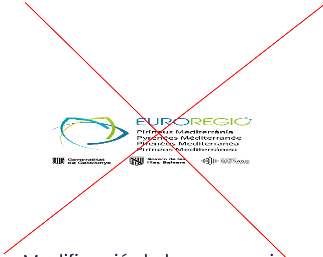
Modificació de les proporcions