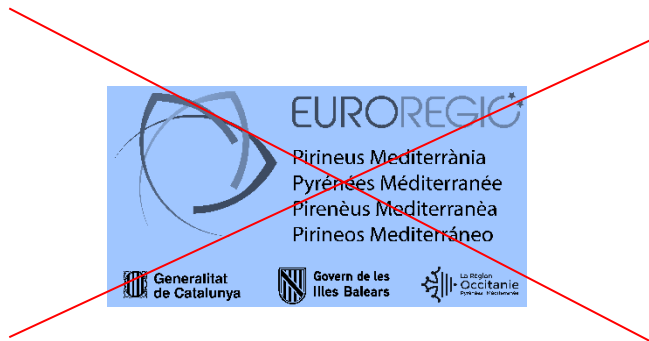
Utilització del logotip sobre fons de colors i sense zona de protecció