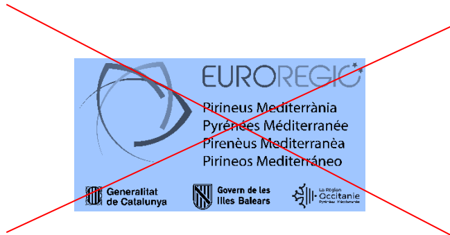
Utilisation du logo sur fond coloré, même clair sans zone de réserve blanche