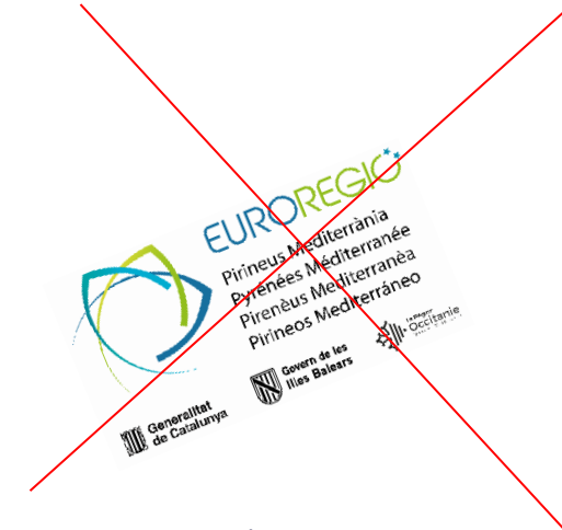
Logo en diagonal