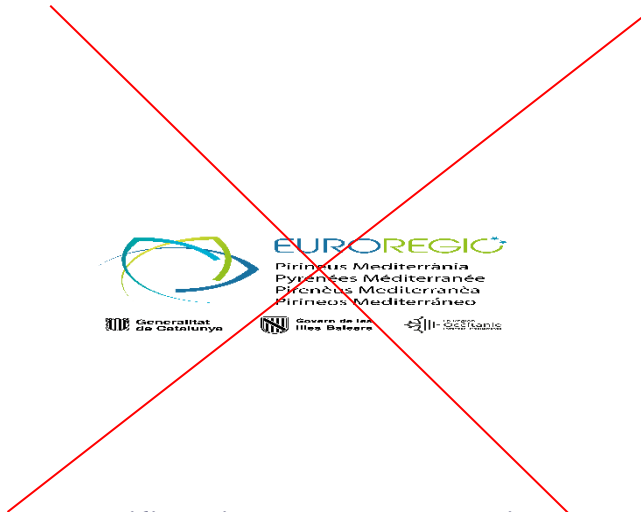
Modification des proportions