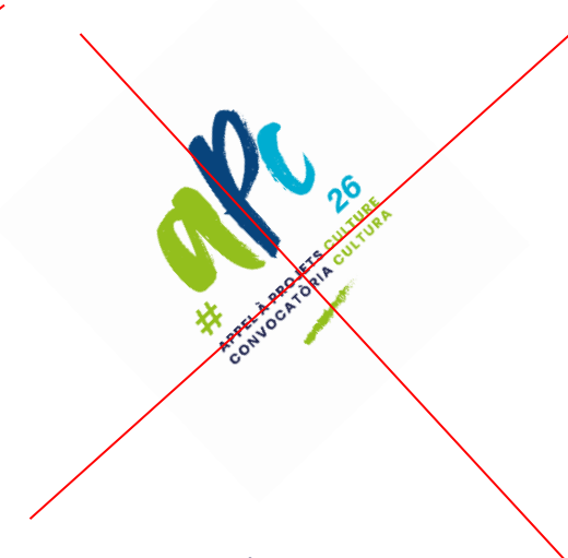
Logo en diagonal