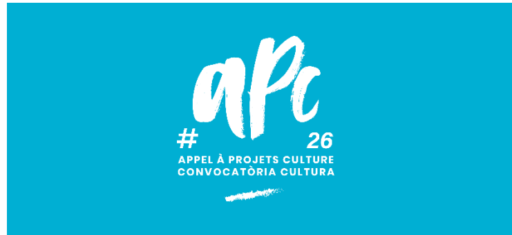
Priorité au logo blanc pour l'utilisation du logo sur fond coloré