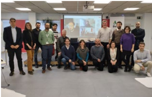
Llançament del projecte LocAll4Flood a la seu del Centre Tecnològic BETA. Vic. 8 i 9 d'abril de 2024.

En aquesta línia ja actua el projecte LocAll4Flood , que ha aconseguit progressos notables, amb el desenvolupament d'un catàleg de solucions basades en la natura per a la gestió de les inundacions, la configuració d'una aplicació d'alerta i la implementació d'enquestes sobre la percepció dels riscos en zones d'influència.