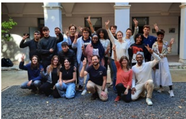
Fòrum de la joventut del projecte Youth for Green EuroRegio Future. Girona. 4 i 5 d'octubre de 2024.

La presidència catalana de l'Euroregió ha impulsat l'Assemblea Euroregional de Joventut (AEJ) en dos aspectes. En primer lloc, reforçant-ne el funcionament intern i en segon lloc treballant