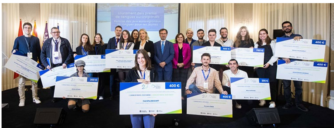
Premis del premi CREA OCCAT. Barcelona. 7 de novembre de 2024.

En relació al Concurs de joves creadors a les xarxes socials en català i occità , al febrer de 2023 es va fer entrega dels premis de la primera edició del concurs, convocada a l'octubre de 2022. La cerimònia de lliurament, que va tenir lloc a Tolosa de Llenguadoc durant el traspàs de la presidència d'Occitània a Catalunya, va posar de manifest la capacitat creadora del jovent de l'Euroregió. En total es van repartir 15 premis a joves d'entre 16 i 30 anys que encoratgen l'ús del català i l'occità a les xarxes socials. A finals de 2023, i després de l'èxit de la primera convocatòria, la Comissió de Cultura va llançar una nova convocatòria del concurs, amb l'adjudicació de 16 premis a joves creadors. La cerimònia de lliurament dels premis d'aquesta edició va tenir lloc durant la celebració dels 20 anys de l'Euroregió el 7 de novembre de 2024.