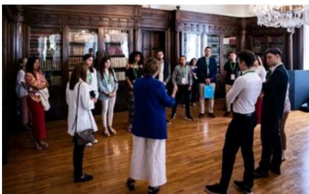
La consellera d'Acció Exterior i Unió Europea de Catalunya s'adreça als membres de l'Assemblea Euroregional de la Joventut que participaren en els MedCatDays 2023. Barcelona. 12 de juny de 2023.