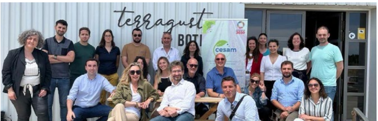
Reunió del Comitè Executiu del projecte CESAM. Visita posterior a l'empresa Terracor. Palma. 23 i 24 de maig de 2024.