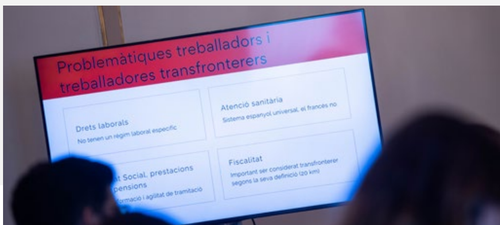
Pantalla en què es projecten les principals problemàtiques dels treballadors i treballadores transfronterers, que es van debatre durant el 20è aniversari de l'Euroregió. Barcelona. 7 de novembre de 2024.

D'altra banda, l'Euroregió s'ha beneficiat d'un ajut de fons europeus a través del programa B-solutions, gràcies al qual no només s'han identificat les problemàtiques de fiscalitat i de protecció social —entre d'altres— que tenen els treballadors transfronterers, sinó que també s'han proposat possibles solucions. Per avançar en aquest àmbit, en el marc de la plataforma de les AECT del Comitè Europeu de les Regions i la col·laboració de la Comissió Europea, l'Euroregió participa en una reflexió conjunta sobre l'estatut del treballador de les AECT.