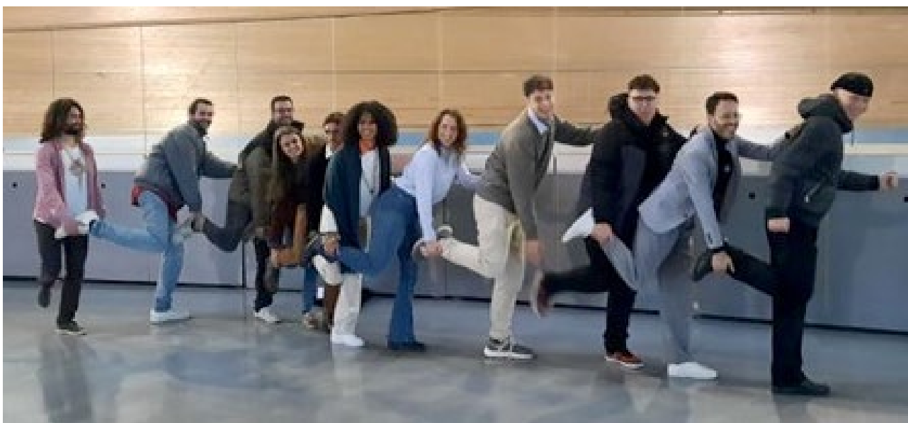
Assemblea General de l'AEJ per a la renovació dels seus membres. Palma. 24 al 26 de gener de 2025.

L'AEJ ha treballat intensament en tres àmbits d'actuació: i) la lluita contra el canvi climàtic i la protecció d'espais naturals, a través de la participació en iniciatives com Let's Clean Up Europe i el projecte