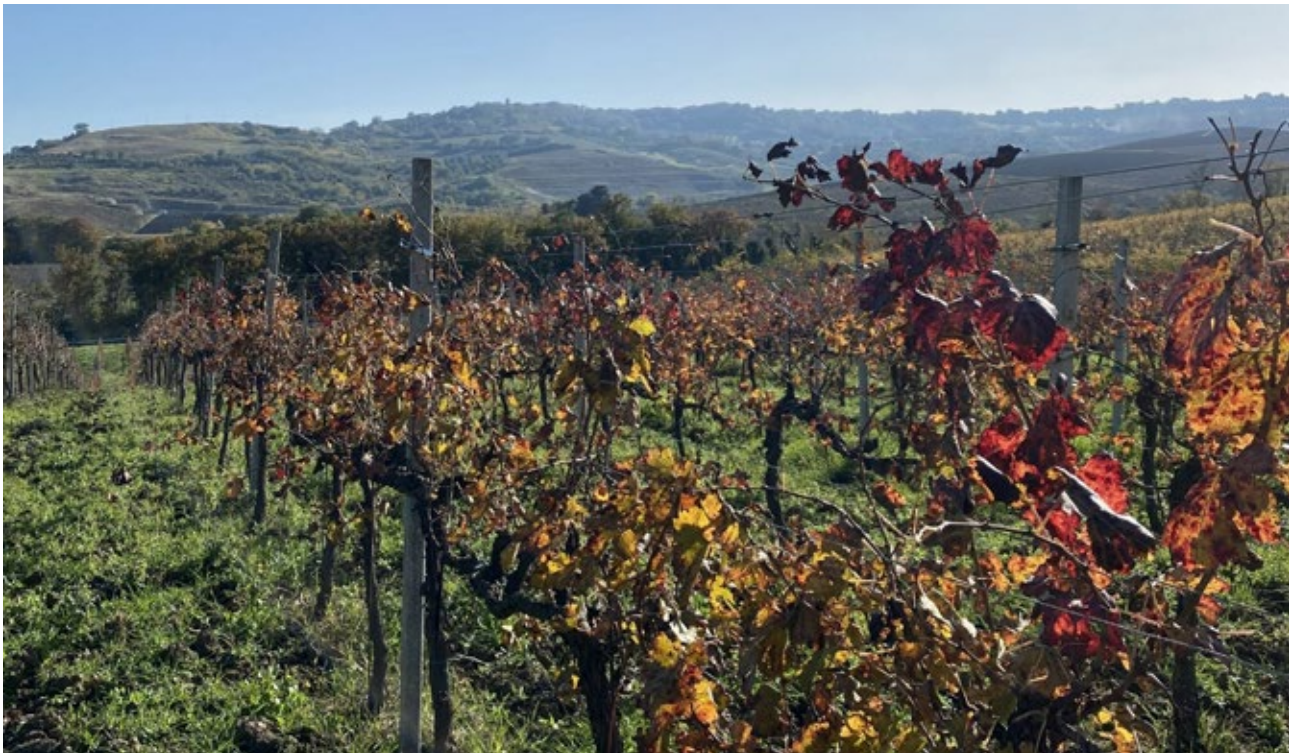
Visita a una parcel·la de vinya experimental en el marc del projecte Carbon Farming Med, on s'apliquen tècniques de captura de carboni, com la cobertura vegetal del sòl. Campobasso, Itàlia. 27 de novembre de 2024.

Pel que fa als projectes transfronterers aprovats en el marc de l'AFLE, que contribuiran a l'adaptació i mitigació al canvi climàtic , la presidència catalana ha impulsat els projectes següents: el projecte OPALÉ, que instal·larà un radar oceanogràfic al centre del golf de Lleó, amb el qual es farà un seguiment dels corrents marins que permetrà fer-ne un mapa precís, i proporcionarà noves dades en temps real als actors del territori; el projecte DUAL, també aprovat en la convocatòria de l'AFLE, que impulsarà la restauració dunar com una solució per mitigar l'impacte de la pujada del nivell del mar; el projecte ALIEN-OCCICAT, que cerca fomentar l'intercanvi d'informació sobre les espècies invasores i el monitoratge d'aquestes; i el projecte TRAP, que desenvoluparà estratègies participatives per a la gestió de la contaminació plàstica a la costa de l'AFLE.