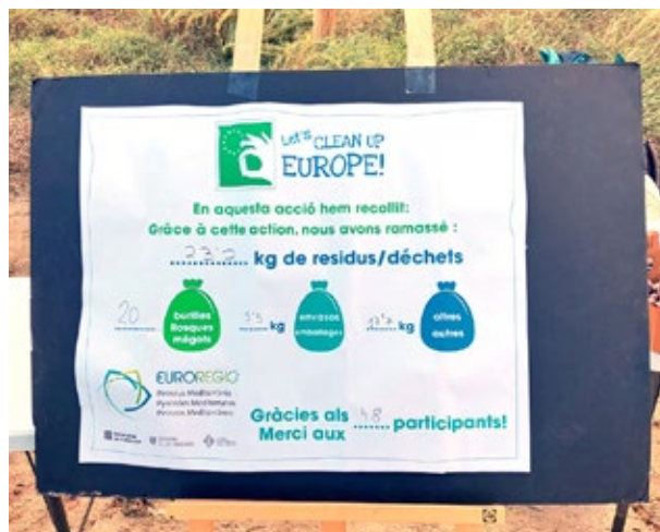
Resultats de la recollida de residus durant l'edició del 2023 de la iniciativa Let's Clean Up Europe a Ses Salines, Eivissa. 23 de setembre de 2023.