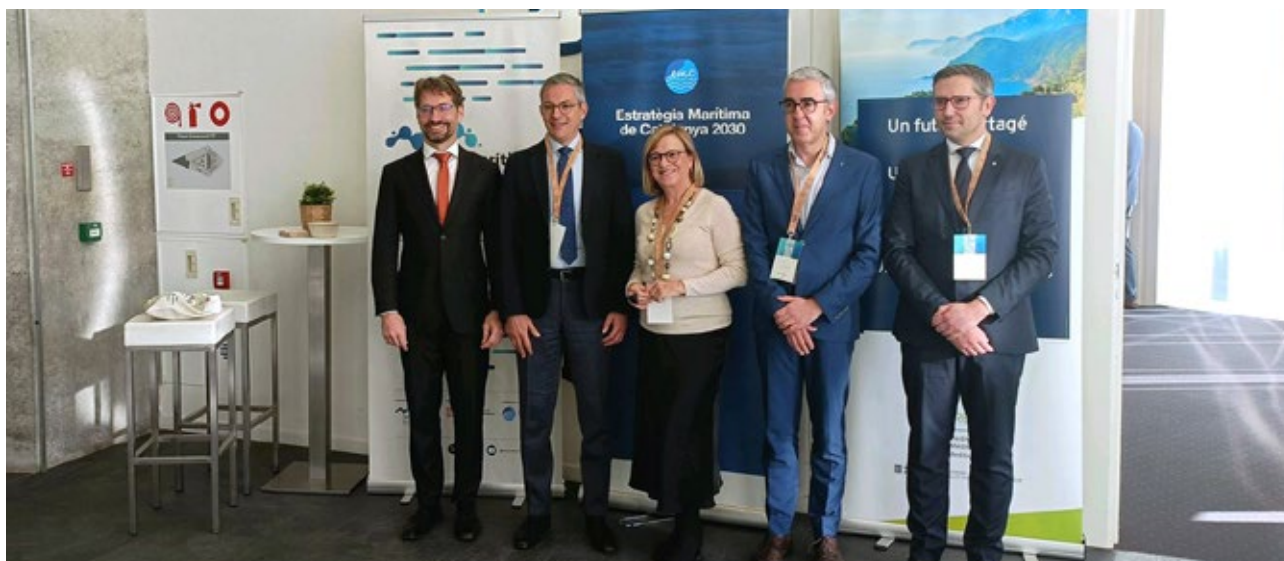
Representants de la Generalitat de Catalunya, cònsol general de França a Barcelona, presidenta de la Xarxa Bluenetcat i secretari general de l'Euroregió. Barcelona. 23 de novembre de 2023.