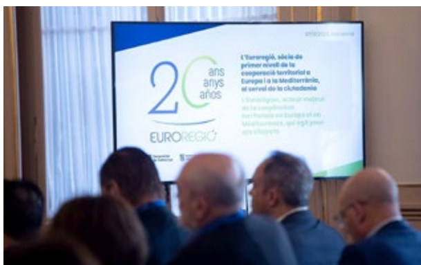
Imatge de la sessió sobre Europa i la Mediterrània en la jornada de commemoració del 20è aniversari de l'Euroregió. Barcelona. 7 de novembre de 2024.

El govern de la Generalitat de Catalunya considera que les regions, així com les euroregions, han de tenir un paper important en les negociacions que seran decisives el 2025 per al futur dels nostres territoris i la nostra economia euroregional. Les diverses reunions establertes amb l'executiu europeu que entrà en funcions l'1 de desembre del 2024 són només l'inici de la voluntat dels membres de l'Euroregió per tenir més influència a la Unió Europea.