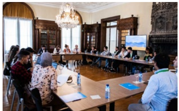
Reunió del grup de treball de Joventut de l'Euroregió amb l'Assemblea Euroregional de la Joventut en el marc dels MedCatDays 2023. Barcelona. 12 de juny de 2023.