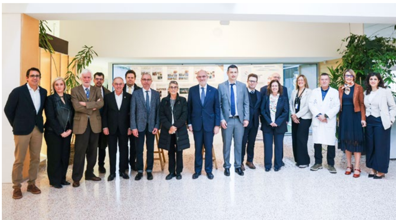
Visita institucional a l'Hospital de Cerdanya, amb motiu del 10è aniversari d'aquest centre sanitari. Puigcerdà. 8 de novembre de 2024.

En particular, per la condició transfronterera de l'Euroregió, la presidència catalana ha apostat per col·laborar encara més amb aquelles entitats amb les quals es comparteixen reptes. L'Euroregió i l'Hospital de Cerdanya tenen la mateixa personalitat jurídica —una Agrupació Europea de Cooperació Territorial. El 2024, l'Hospital de Cerdanya va commemorar el 10è aniversari de la seva entrada en funcionament amb un conjunt d'actes, un dels quals tingué lloc el 8 de novembre a Alp, amb la participació d'autoritats europees. La presidència catalana de l'Euroregió va aprofitar les sinergies amb l'acte del 20è aniversari de l'Euroregió per facilitar la participació d'aquestes persones en els dos esdeveniments.