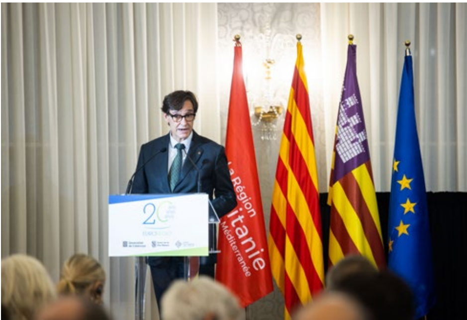
Salvador Illa i Roca, president de la Generalitat de Catalunya i de l'Euroregió, en el tancament de la jornada de commemoració dels 20 anys de l'Euroregió Pirineus Mediterrània. Barcelona. 7 de novembre de 2024.