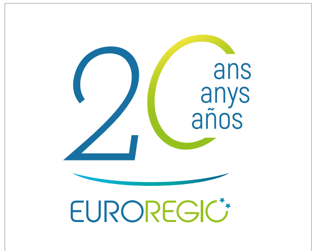
Logotip dels 20 anys de l'Euroregió.

Al llarg de la jornada es va fer èmfasi a promoure la participació activa dels governs regionals en àmbits com la cultura, la societat civil i el jovent, així com la consolidació de programes regionals que permetin afrontar reptes territorials . Hi va haver actuacions culturals representatives dels tres territoris de l'Euroregió, tal com s'exposa a la secció d'Impuls de la cooperació cultural. El servei de càtering el va oferir l'Escola d'Hostaleria de Barcelona (ESHOB), que va fer palesa la qualitat i la diversitat gastronòmica euroregional, a més de l'excel·lència de la formació professional en hostaleria.