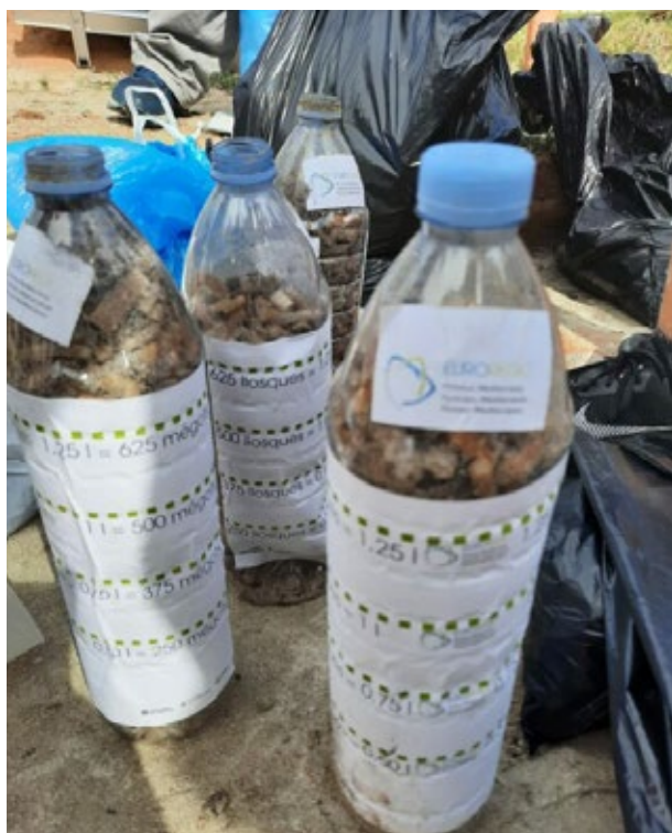
Burilles recollides en ampolles de plàstic durant l'edició del 2023 de la iniciativa Let's Clean Up Europe. Ses Salines, Eivissa. 23 de setembre de 2023.

En les iniciatives celebrades el 2023 i 2024, els joves d'escoles i instituts dels tres territoris aplegaren més de 5.700 burilles i 800 kg de residus. A més, després de l'última jornada, el novembre de 2024 els joves dels tres territoris es van reunir en línia per compartir els resultats obtinguts en cada territori i traçar estratègies conjuntes per protegir la biodiversitat i augmentar la consciència social. L'èxit de l'acció conjunta ha comptat amb el suport de l'Assemblea Euroregional de Joventut, i es vol reforçar amb vista a les pròximes edicions.