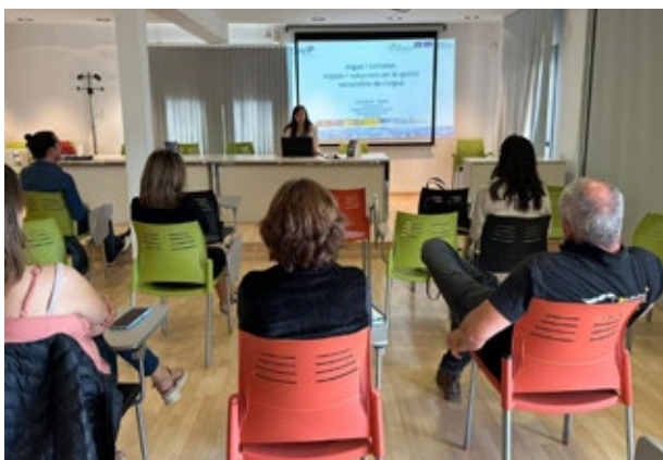
Participants d'una jornada en què s'explicaren mesures per fomentar l'estalvi d'aigua i la reutilització en el sector turístic. Roses. 27 d'abril de 2023.

El projecte ha comptat amb una àmplia participació del sector públic i privat (un total de 303 institucions i entitats), i així ha contribuït a enfortir els vincles per a una millor governança en matèria de l'aigua. Més concretament, el març de 2023 es va participar en la conferència d'alt nivell sobre aigua, que va tenir lloc a Barcelona. Un any més tard, adherint-se a les iniciatives organitzades amb motiu del Dia Mundial de l'Aigua, la conferència final del projecte va tenir lloc a Palma (Illes Balears). Càrrecs electes locals, regionals i actors econòmics del sector turístic del territori euroregional van posar en relleu l'impacte positiu potencial d'aplicar una legislació relativa a la gestió sostenible de l'aigua. Alhora, les recomanacions, les bones pràctiques i les guies tècniques identificades i elaborades en el marc del projecte Wat'Savereuse s'han publicat a la pàgina web del projecte, i s'han difós en les institucions europees i entre els actors del sector tecnològic i industrial amb l'objectiu que aquests aprenentatges i innovacions es coneguin i es portin a la pràctica més enllà del territori euroregional.