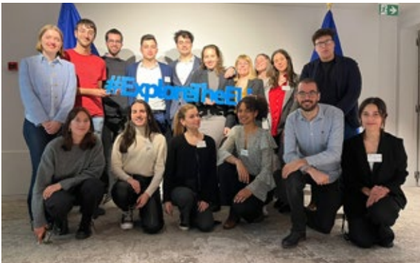
Membres de l'Assemblea Euroregional de la Joventut visiten les institucions europees. Brussel·les. Març de 2023.

L'AEJ ha difós totes les activitats a través dels mitjans de comunicació i les xarxes socials, i també s'han impulsat campanyes digitals. Alhora, l'Euroregió ha estat cap de fila del projecte Youth for Green Euro-Regio Future (Y4 Green ERF) . Aquest projecte, en col·laboració amb 6 socis euroregionals experts en l'àmbit de comunicació personalitzada, ha permès transmetre als més de 700 joves que han participat en els tallers i activitats del projecte la importància de la política de cohesió social i regional europea i dels compromisos europeus en la lluita contra el canvi climàtic . Els joves han produït un vídeo en diferents llengües explicant els resultats del projecte i un manifest amb 5 eixos de sensibilització al voltant de l'hàbitat, el consum, la natura, l'alimentació i la mobilitat. A mode de conclusió, els joves destaquen: "Creiem en una Europa més verda, més justa, i més sostenible, i sabent que vosaltres també hi creieu, obrim les nostres mans i voluntat de participar-hi de manera conjunta".