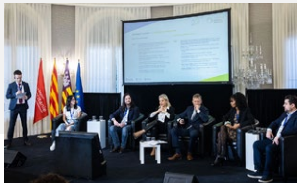
Sessió matinal sobre l'Euroregió i el jovent. Barcelona. 7 de novembre de 2024.