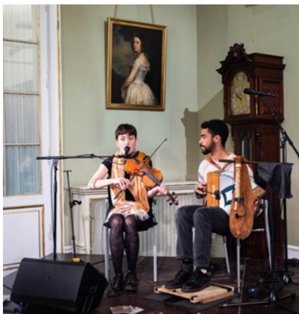
Duo des Cimes (Occitània), duet de música tradicional occitana. Barcelona. 7 de novembre de 2024