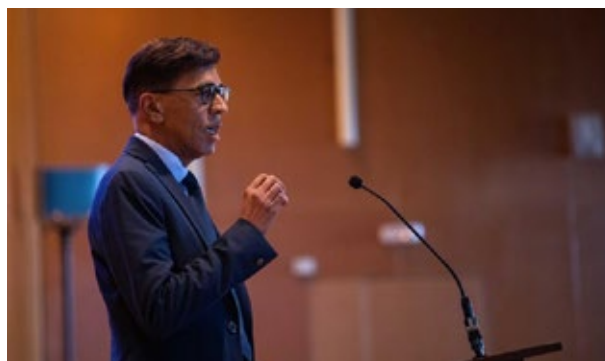
El vicepresident del Parlament Europeu, Younous Omarjee, intervé en l'acte de commemoració del 10è aniversari de l'Hospital de Cerdanya. Palau de Congressos i Esports d'Alp. 8 de novembre de 2024.

El llançament de l'AFLE tingué lloc a Banyuls de la Marenda, el 4 d'abril de 2024. La convocatòria de projectes de l'AFLE del 2024, amb un pressupost del FEDER de 5,5 milions d'euros, ha adjudicat 5 projectes, que s'inicien el 2025. Els projectes contribuiran a la promoció d'itineraris de sensibilització, la implantació de dunes urbanes, el desenvolupament d'estratègies participatives per a la recollida de residus al mar i a terra, la instal·lació d'un radar oceanogràfic, l'intercanvi d'informació sobre les espècies invasores i el monitoratge d'aquestes, o la fabricació i la implementació de bicibusos elèctrics, entre d'altres. Els projectes s'exposen de manera detallada en altres seccions del balanç i en l'annex.