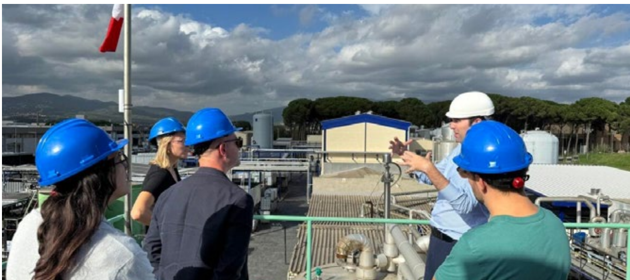
Visita de terreny en una empresa realitzada en el marc del projecte CESAM, organitzada per ACCIÓ. Barcelona. 16 d'octubre de 2024.

La Comissió d'Innovació de l'Euroregió organitzà, el novembre de 2023, una sessió d'intercanvi d'experiències dels tècnics dels tres membres del sector d'automoció i mobilitat. S'hi compartiren dades clau dels tres territoris i s'hi exposaren els reptes comuns. També s'organitzà la visita d'una delegació occitana a la fira Smart Cities, a Barcelona