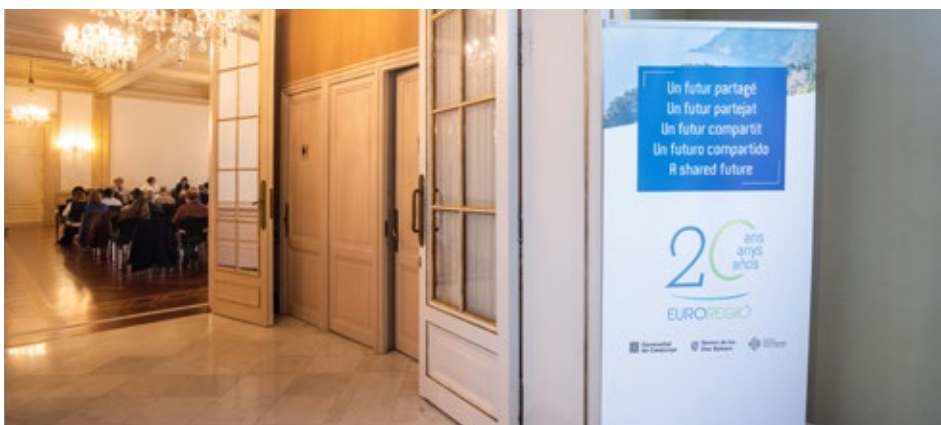
Palau de Pedralbes durant la jornada de commemoració del 20è aniversari de l'Euroregió. Barcelona. 7 de novembre de 2024.