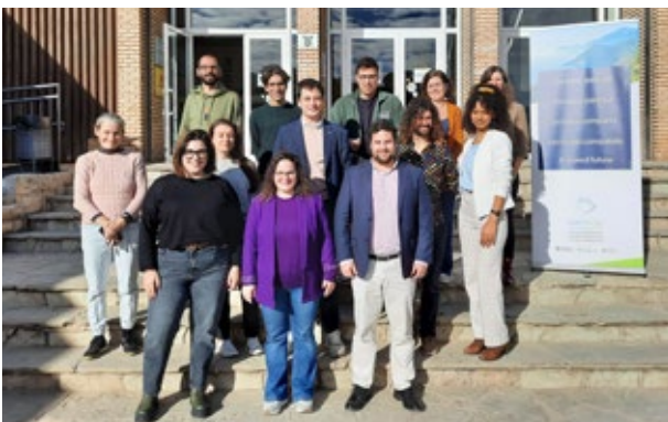
Reunió de l'Assemblea Euroregional de la Joventut. Coma-ruga. 24 de novembre de 2023.