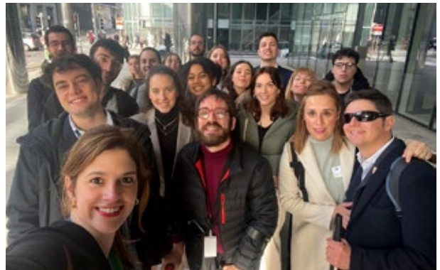
Membres de l'Assemblea Euroregional de la Joventut visiten les institucions europees. Brussel·les. Març de 2023.