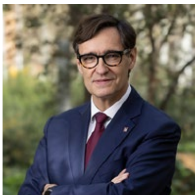
Salvador Illa i Roca President de la Generalitat de Catalunya

L'Euroregió és un clar exemple que la política de l'optimisme responsable, de l'entesa, de l'acord i de teixir complicitats és possible i serveix per millorar la vida de les persones