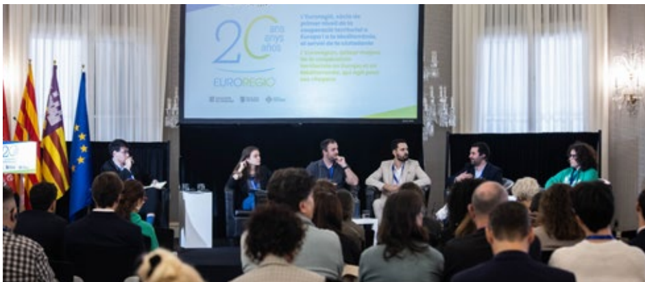
Sessió que tingué lloc a la Sala Gran del Palau de Pedralbes en el marc de la jornada de commemoració del 20è aniversari de l'Euroregió. Barcelona. 7 de novembre de 2024.