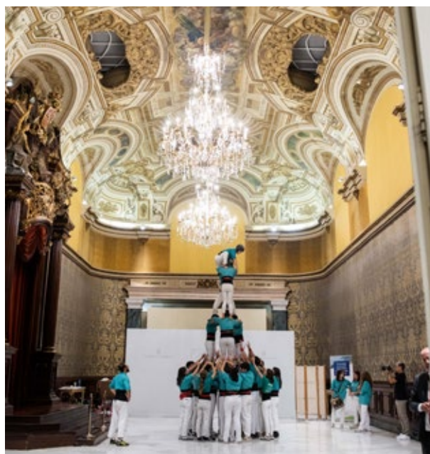
Actuació castellera de la colla d'Els Arreplegats al Saló del Tron del Palau de Pedralbes, Barcelona. 7 de novembre de 2024.