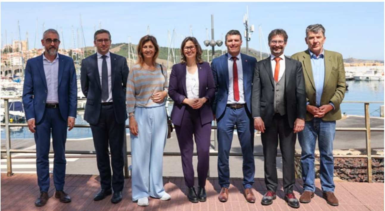
Representants institucionals i polítics de l'Euroregió i europeus en la inauguració de l'Àrea Funcional Litoral Est (AFLE). Banyuls de la Marenda. 4 d'abril de 2024.

La participació de l'Euroregió en l' Àrea Funcional Litoral Est (AFLE) del POCTEFA 2021-2027 té un cost de 700.793 €, el 65% dels quals és finançat pel FEDER, i amb una durada fins al juliol de 2029. L'AFLE contribueix a la creació d'un sistema de governança promotor de transformacions en el territori, i comprèn el territori