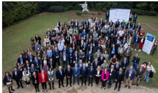
Participants del 20è aniversari de l'Euroregió Pirineus Mediterrània. Barcelona. 7 de novembre de 2024.

La Generalitat de Catalunya, per mitjà del Pla Brussel·les, cerca millorar la incidència en qüestions clau, com ara el futur finançament de la Unió Europea, establir un nou Pacte pel Mediterrani, impulsar la competitivitat al conjunt del territori o fer efectiva l'oficialitat del català a les institucions europees