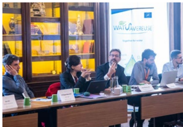
Participants de la reunió de la Comissió de Medi Ambient de l'Euroregió. Barcelona. 7 de novembre de 2024.