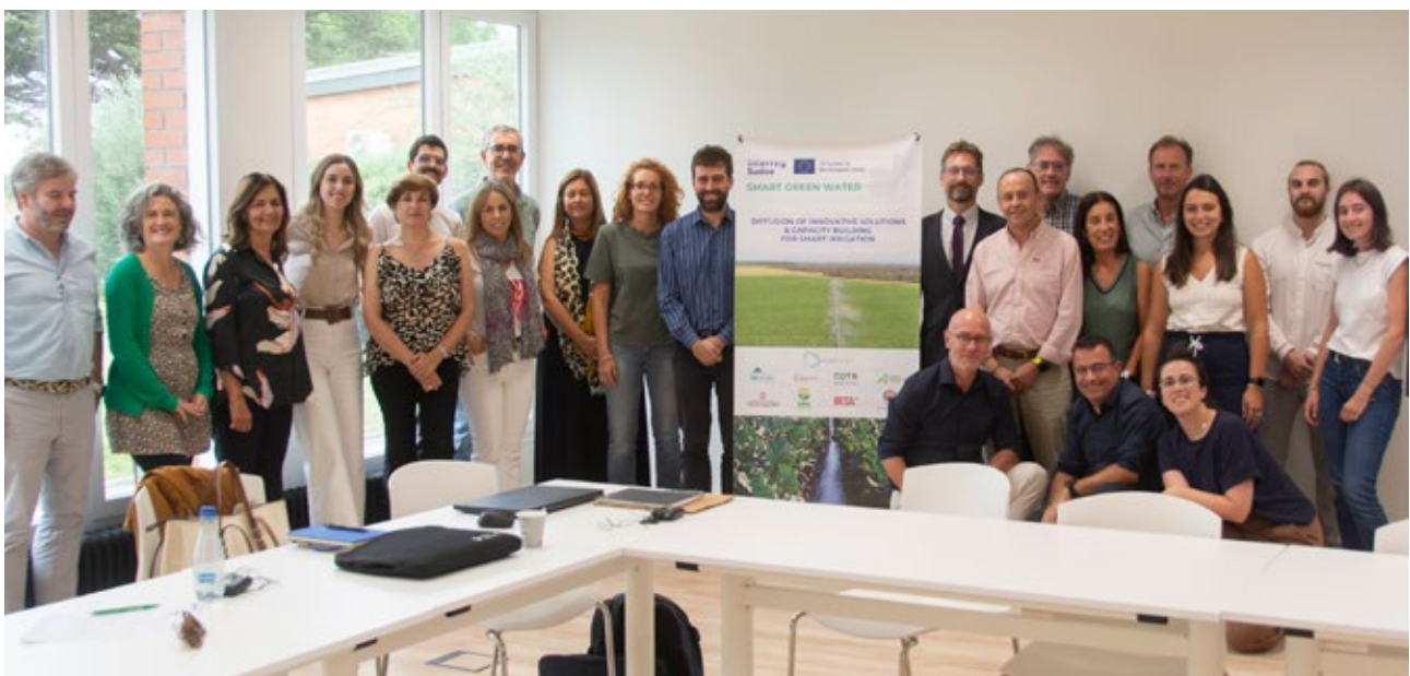
Visita de terreny a una empresa que es va fer en el marc del projecte CESAM, organitzada per ACCIÓ. Barcelona. 16 d'octubre de 2024.

Després del llançament del projecte el febrer de 2024 a Vic, els socis del projecte han identificat els projectes europeus complementaris per trobar sinergies, han fet un informe sobre el model econòmic i el potencial del mercat del carboni per a l'agricultura, han seleccionat els indrets on es duran a terme proves pilot en el marc d'una convocatòria oberta a agricultors, i s'ha definit la metodologia de mostratge del sòl que s'utilitzarà en el projecte.