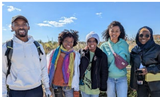
Joves que participaren en la recollida de residus durant l'edició del 2024 de la iniciativa Let's Clean Up Europe a la desembocadura de l'Orb, Domaine des Orpellières. 4 d'octubre de 2024.