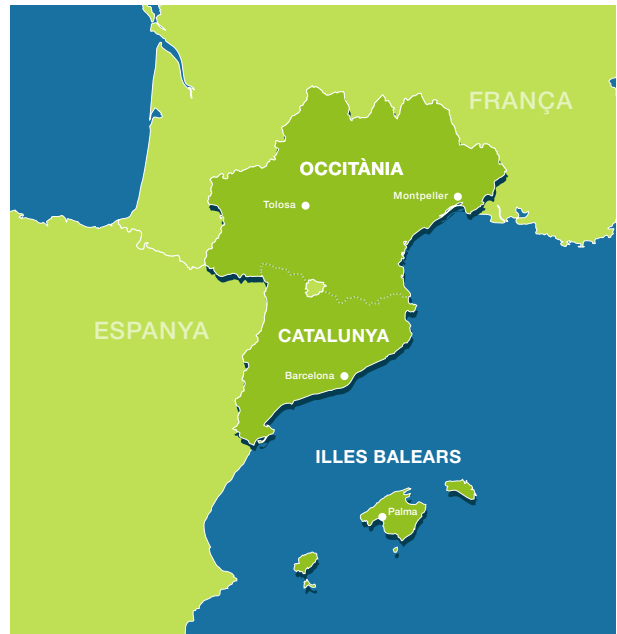
Mapa de l'Euroregió Pirineus Mediterrània.

Durant la presidència catalana hem treballat per reforçar aliances més enllà del perímetre euroregional i per promoure iniciatives que fomentin la sostenibilitat i les iniciatives locals. En aquest sentit, cal destacar la creació de l'Àrea Funcional Litoral Est del Programa Interreg de Cooperació Territorial Espanya-França-Andorra (POCTEFA). Aquesta Àrea —liderada per l'Euroregió— aporta 5,5 milions d'euros de subvenció del Fons Europeu de Desenvolupament Regional (FEDER) a projectes de cooperació transfronterera dedicats a la preservació