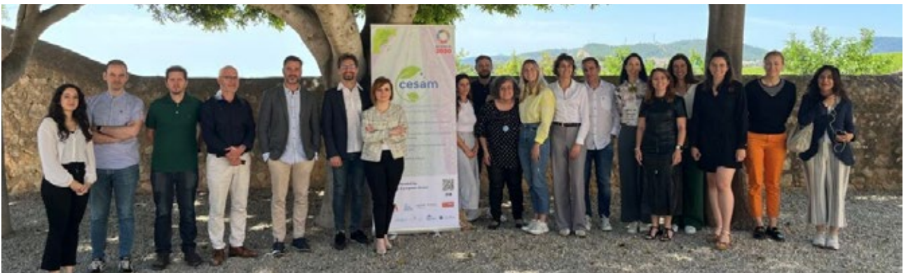
Reunió del Comitè Executiu del projecte CESAM amb l'Interregional Innovation Investments (I3) Instrument. La Fundació Bit va acollir la trobada al Parc Balear d'Innovació Tecnològica. Palma. 23 i 24 de maig de 2024.

Per exemple, en el marc del 20è aniversari de l'Euroregió, es van organitzar dues taules rodones amb acadèmics, representants sindicals i altres actors dels tres territoris. En aquestes taules, els enriquidors debats van permetre fer palesa la necessitat de crear un estatut del treballador transfronterer per regular adequadament les conseqüències en el món laboral introduïdes per la digitalització del treball. Alhora, atès que no hi ha homogeneïtat en la recollida de dades, s'insta a les diverses administracions a treballar de manera col·laborativa per crear una base de dades conjunta entre Occitània, Balears i Catalunya, ja que aquesta permetria promoure un turisme més sostenible i competitiu en el territori euroregional.