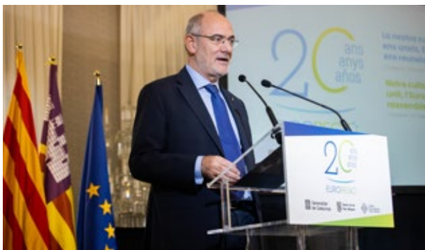
Jaume Duch i Guillot, conseller d'Unió Europea i Acció Exterior de la Generalitat de Catalunya. Barcelona. 7 de novembre de 2024.