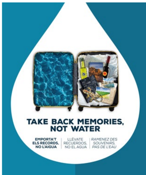
Imatge de la campanya «Emporta't els records, no l'aigua», del projecte Wat'SaveReuse.

La consolidació del turisme responsable, és a dir, un turisme més sostenible i més competitiu, ha estat una de les prioritats de la presidència catalana de l'Euroregió. Un gran nombre d'actors euroregionals han treballat per complir aquest objectiu: les comissions de Medi Ambient, Turisme i Innovació, els consells econòmics i socials dels tres territoris, i altres. Sota el guiatge d'aquests actors euroregionals i per mitjà de les empreses i institucions turístiques, s'ha avançat en l'objectiu de teixir consens entre els diferents agents socials, polítics i econòmics euroregionals per crear un nou model turístic que tingui en compte els impactes tant positius com negatius de l'activitat. Aquest nou model, doncs, es basa en un turisme que prioritza la cultura, el paisatge i el patrimoni, i alhora contribueix a la lluita contra el canvi climàtic, preserva la biodiversitat i camina cap a la descarbonització de l'economia.