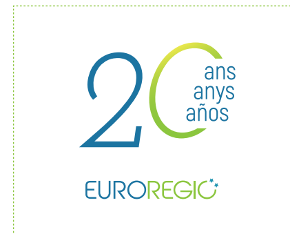
NE PAS SUPPRIMER D'ÉLÉMENTS