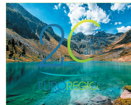
SUR VISUELS SANS FILTRE NOIR