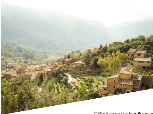
© Gobierno de las Islas Baleares

Estructurada en Agrupación Europea de Cooperación Territorial desde 2009, la Eurorregión Pirineos Mediterráneo ha demostrado su capacidad para movilizar a los actores de su territorio en sectores clave, tales como la economía, la innovación, la investigación, la educación superior, la cultura, el turismo y el medio ambiente. Debido a su historia, sus valores comunes y sus ambiciones cruzadas, la Generalidad de Cataluña, el Gobierno de las Islas Baleares y la Región de Occitania desean proseguir a través de la Eurorregión la construcción de un polo de cooperación de referencia en este cruce de caminos de Europa y en pleno corazón del Mediterráneo.