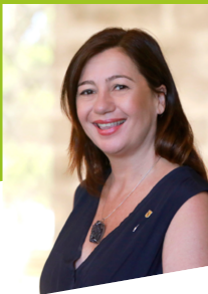
Presidenta del Gobierno de las Islas Baleares