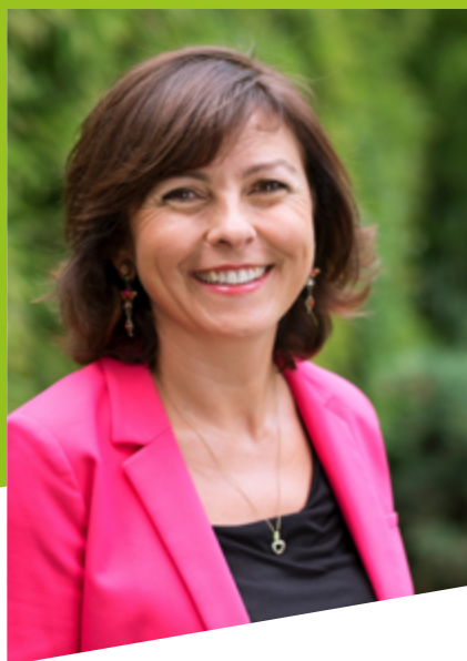
Presidenta de la Eurorregión

Presidenta de la Región de Occitania / Pirineos-Mediterráneo