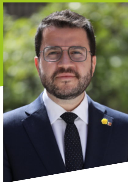
Presidente de la Generalitat de Cataluña